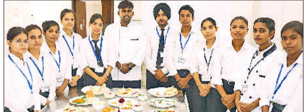
जींद। छात्रों द्वारा बनाए गए व्यंजन।