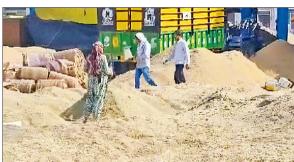
हुहला-चौका। अनाज मंडी में पसरा फूस।