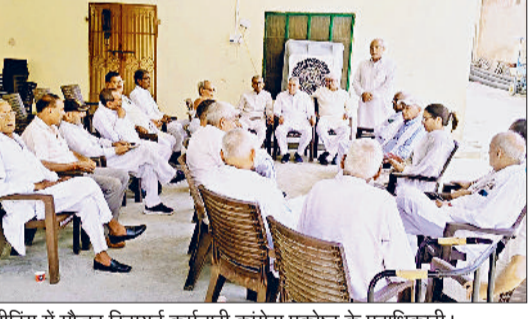
जीद। मीटिंग में मौजूद रिटायर्ड कर्मचारी कांग्रेस प्रकोष्ठ के पदाधिकारी।

घोषणा कर रखी है, उसका कार्य भी जल्द से जल्द शुरू करवाया जाए। जीद-कैथल रोड अमरहेड़ी से शाहपुर गांव तक बारिश की वजह से टूट चुका है। इसकी जल्द से जल्द मरम्मत करवाई जाए। कंडेला ने कहा कि जीद जिला