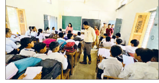
नरवाना। बच्चों से बातचीत करते एसडीएम।