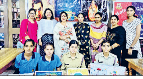
जीद। प्रतियोगिता में छात्राओं द्वारा बनाए गए पोस्टर।