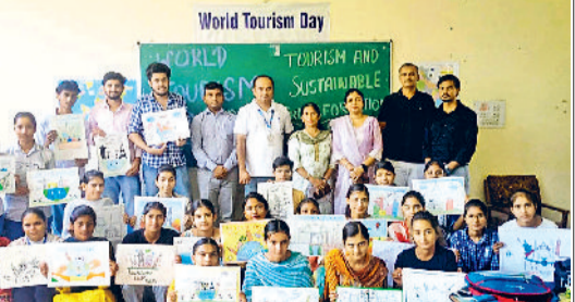
नरवाना। प्रतियोगिता में छात्राओं द्वारा बनाए गए पोस्टर।