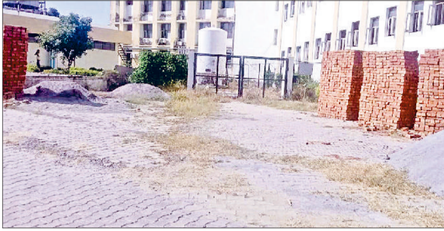
जींद। चला हुआ निर्माण कार्य।

निर्माणाधीन चार फीट के नए गेट का कार्य अंतिम चरण में है। अब डिलीवरी के बाद महिलाओं को एंबुलेंस के लिए मुख्य गेट तक नहीं जाना पड़ेगा। सीधे गायिनी वार्ड के पास ही एंबुलेंस सुविधा जच्चा व बच्चा को उपलब्ध होगी।