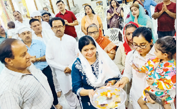
माता वैष्णवी धाम में नवराण महायज्ञ में आहुति डालने के बाद पूजा करते श्रद्धालु।