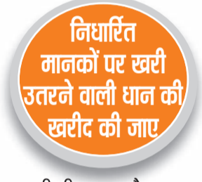
निर्धारित मानकों पर खरी उतरने वाली धान की खरीद की जाए