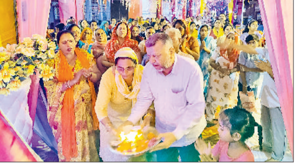
जीद। जयंती देवी मंदिर में मां भगवती की आरती करते श्रद्धालु।