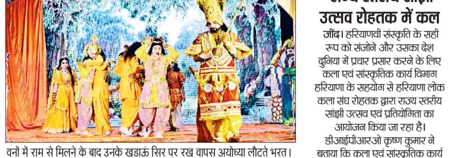
नवों में राम से मिलने के बाद उनके खड़ाऊं तिर पर रख वापस अयोध्या लौटते भरत।